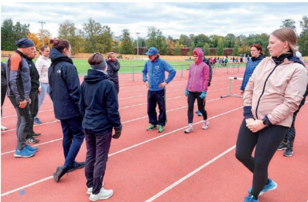
HKV:n syksyn 2022 yleisurheilukoululaiset tutustumassa kilpakävelyn tekniikkaan.

Esbo IF, Haukiputaan Veikot, Helsingin Kisa-Veikot, HIFK-suomeksi ja ruotsin kielellä, Hämeenlinnan Tarmo, Janakkalan Jana, Jyväskylän Kenttäurheilijat, Keski-Uudenmaan Yleisurheilu, Kunto-Pirkat, KU-58 Vantaa, Lahden Ahkera, LahtiSport, Liedon Parma, Nakkilan Vire, Tampereen Pyrintö, Turun Urheiluliitto, Porin Tarmo, Raahen Vesa, Vantaan Salamat, Viipurin Urheilijat.